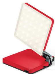
Roxxane Fly in Knallrot: Sie setzt einen kräftigen Akzent und leuchtet bis zu 20 Stunden, je nach gewählter Helligkeit. Zusammengeklappt passt sie in jede Tasche und ist überall dabei.