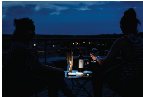
Sommerabende draußen: Roxxane Fly ist die ideale Begleiterin im Outdoorbereich; nur Nässe verträgt sie nicht.