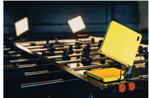
Im EM-Fieber ist der Tischkicker ein passender Ort für die akkubetriebene Roxxane Fly, gefertigt vom Stuttgarter Premiumhersteller Nimbus. Die LED-Leuchte inspiriert dazu, sie an seinem Lieblingsort aufzustellen.