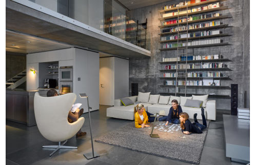
Eine Leuchte in zwei Ausführungen: die Roxxane Leggera CL.