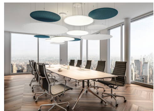
Das Design der PADs greift die Formensprache der Nimbus Leuchten auf.