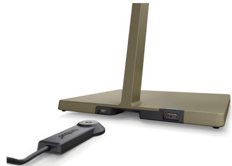
Der Ladeprozess ist bei der akkubetriebenen Roxxane Leggera CL über das magnetische Dock möglich.