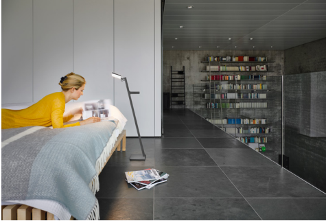
Die Leuchte Roxxane Leggera CL folgt ihrem Nutzer und spendet überall dort Licht wo es benötigt wird.