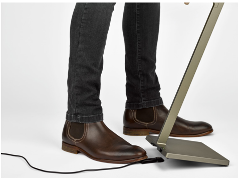
Über einen magnetischen Lade-Puck wird Roxxane Leggera CL an das Stromnetz angeschlossen. Ein gut hörbares Klack signalisiert, dass die Verbindung geglückt ist.