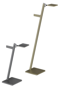
Die kabellose Roxxane Leggera CL bietet viele Einsatzmöglichkeiten im Home- und temporär im trockenen Außenbereich.