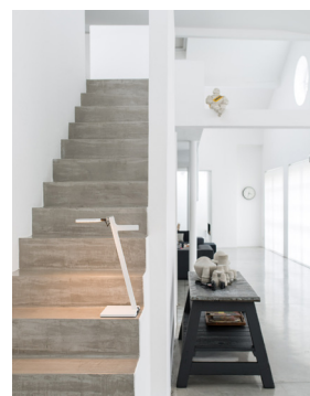
Der integrierte Hochleistungsakku versorgt die portable LED-Leuchte Roxxane Leggera CL mit Energie für bis zu 100 Stunden.