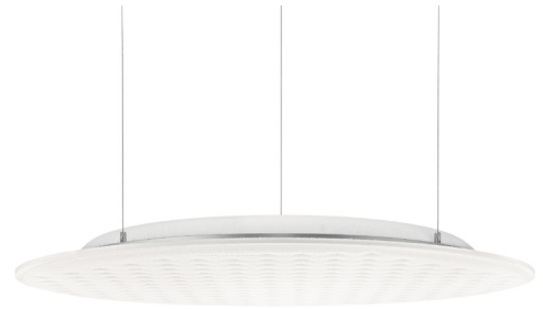
Die abgependelten Rossoacoustic PADs passen perfekt zu ihren leuchtenden Pendants, den Nimbus Modul Q und R Project LED-Leuchten.